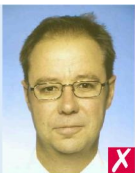
Не натуральный цвет лица