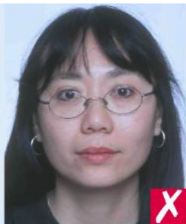
Оправа на глазах