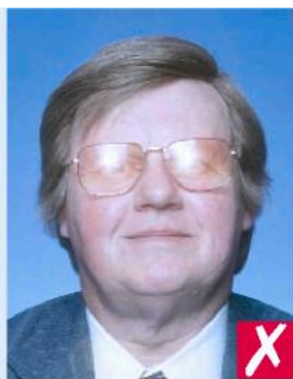
Блики на очках