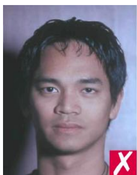
Тень на фоне