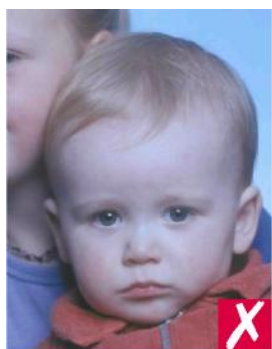
Посторонние люди и предметы на фото