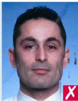
Помечены чернилами /помяты