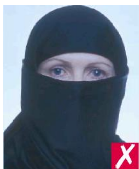
Лицо закрыто платком