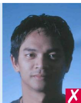
Тень на лице