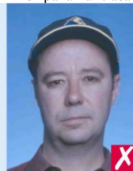
В головном уборе