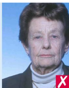
Не по центру