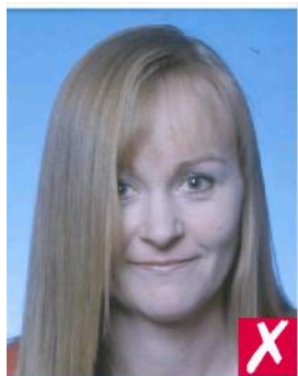
Волосы на лице