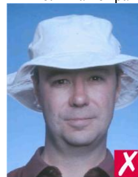
В головном уборе