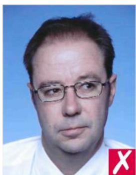
Смотрит в сторону