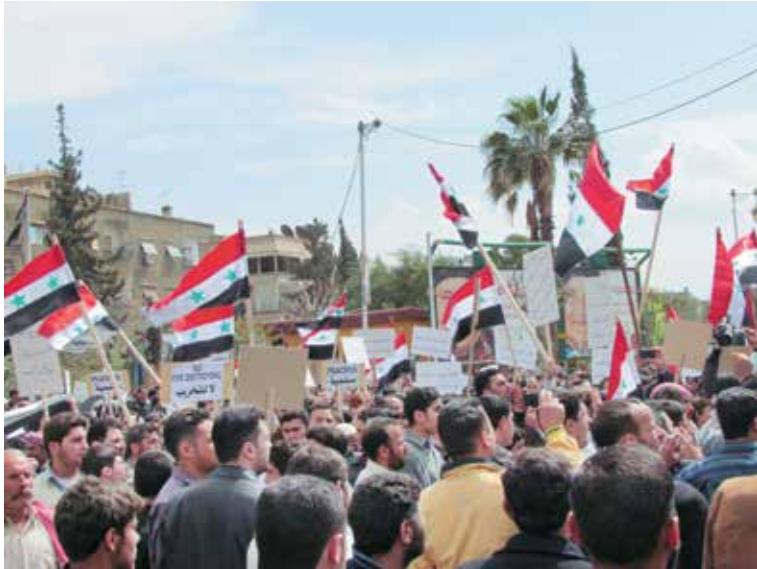
Сирия-2011: очередной адресат демократизации со стороны «просвещенного Запада»

нарушится, это немедленно приведет к плохим последствиям для Европы и для Средиземноморья. Все будут в опасности!»