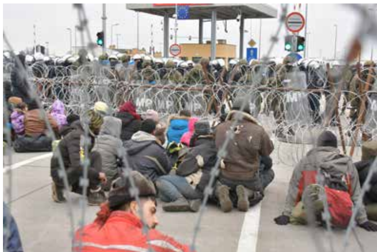
Утро в лагере беженцев