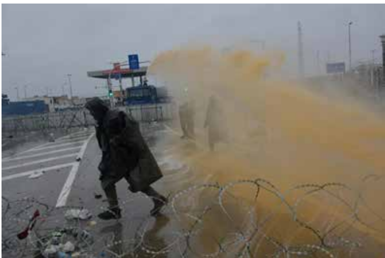
Отчаяние беженцев — и химическая атака со стороны Польши

иначе как насильственные действия в отношении лиц, находящихся на территории другой страны. Белорусская сторона инициирует расследование данного инцидента.