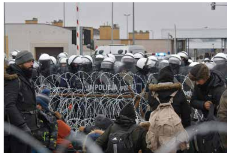
Заграждения на погранпереходе