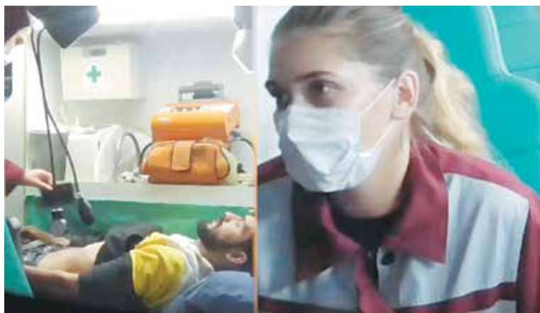
Белорусские медики оказывают помощь беженцам с Ближнего Востока на границе Евросоюза

отправились в разведку, чтобы убедиться в отсутствии со стороны Беларуси пограничных нарядов. После этого польские стражи границы планировали тайно вытеснить очередную группу беженцев в Беларусь. Однако, благодаря действиям белорусских пограничников, данная попытка была пресечена.