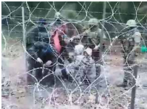
Избитые польскими пограничниками курдские беженцы

стороны польских военнослужащих стало «нормой» в понимании европейских стран. Несмотря на очевидные доказательства бесчеловечных мер, Польша пытается не только скрывать подобные факты от общественности, но и обвинять Беларусь в провокациях на границе, заявляя, что «с белорусской стороны транслируют записи плача и криков детей». Однако обнародованное видео прямо указывает на то, что это не трансляции с территории Беларуси, а результат реальных жестких действий польских правоохранителей на границе.