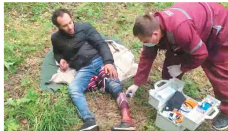
Белорусские медики оказывают помощь беженцам с Ближнего Востока на границе Евросоюза

16 сентября. На участке заставы «Русаки» Гродненской погрангруппы белорусские пограничники увидели свет фар и услышали шум на сопредельной территории. Оперативно прибыв к месту возможного нарушения границы, они обнаружили в заграждении, установленном польской стороной, запутавшегося в колючей проволоке человека. Несмотря на прибытие белорусской погранслужбы и мучения беженца, польские силовики продолжали гнать мужчину на белорусскую территорию через травмирующее заграждение. Оценив происходящее и риск гибели мужчины, белорусская сторона решила оказать неотложную помощь и вызвала бригаду