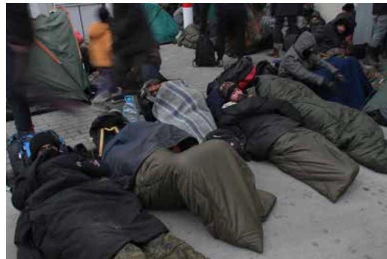
Вечер на погранпереходе