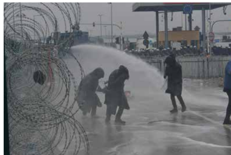
Атака водометов, в том числе с использованием химических веществ, на беженцев (в том числе женщин и детей) и представителей белорусских и зарубежных СМИ