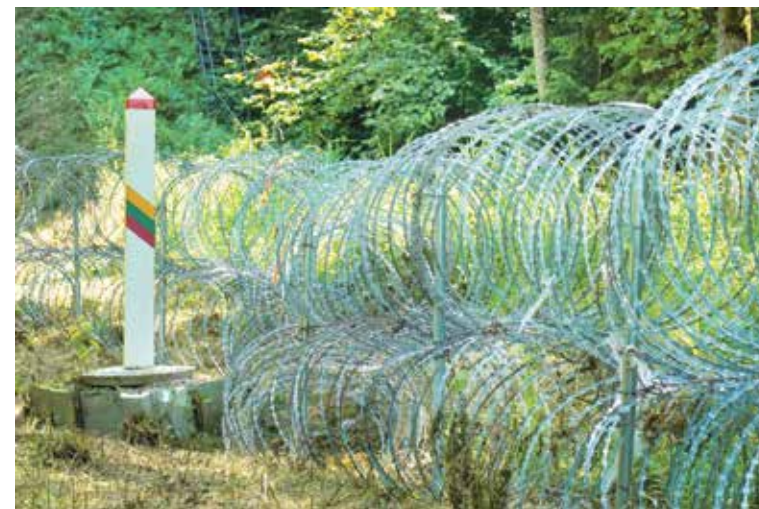
Литва опутывает свою и внешнюю границу ЕС «егазой». Июль 2021 года