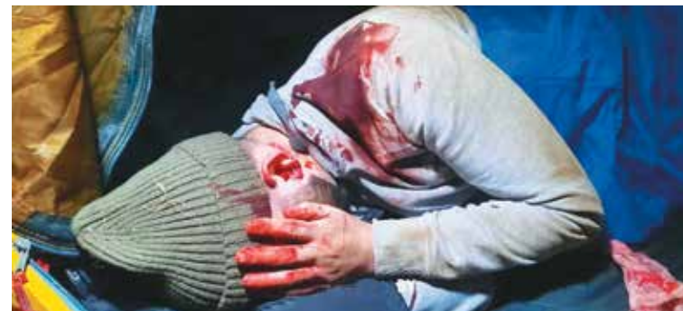
Избитые польскими пограничниками курдские беженцы

9 ноября. Польский автодорожный международный пункт пропуска «Кузница Белостоцкая» (с белорусской стороны — «Брузги») с 9:00 в одностороннем порядке остановил оформление лиц и транспортных средств, следующих через государственную границу. Объективных причин для принятия такого решения белорусская сторона не видит, и при возобновлении работы польского пункта пропуска белорусские службы готовы обеспечить оформление в штатном режиме.