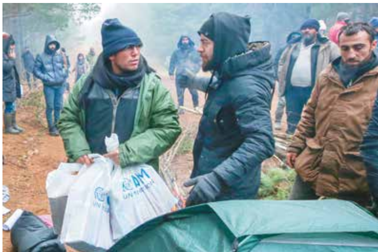
Представители Управления Верховного комиссара ООН по делам беженцев ознакомились с ситуацией в лагере беженцев на границе с Польшей и передали мигрантам небольшую гуманитарную помощь