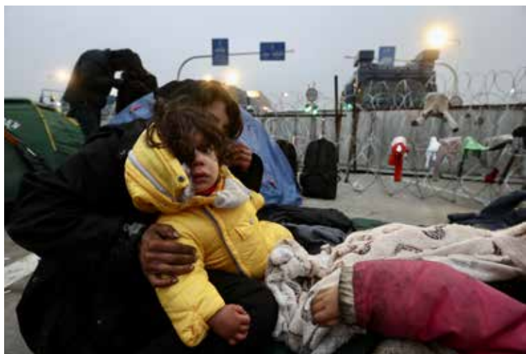
У польского пункта пропуска