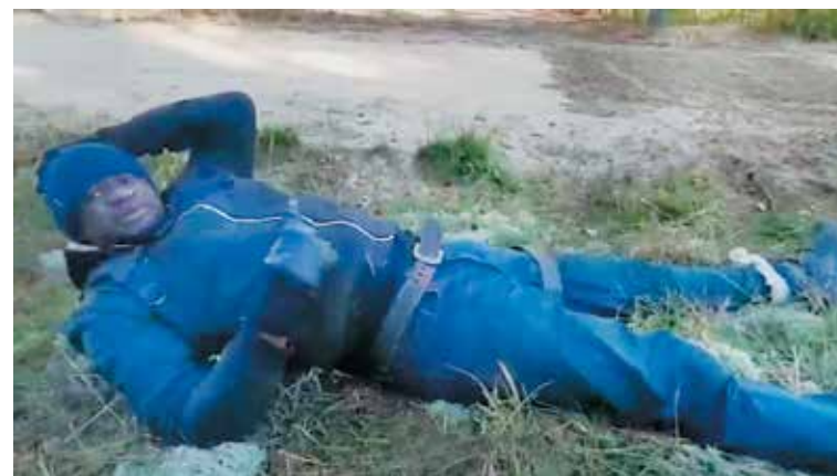
Скриншот сайта Государственного пограничного комитета Республики Беларусь

растеряна и напугана. В спину иностранцам кричали «You must go!» и указывали в сторону Беларуси. Попытка нарушения границы была предотвращена белорусскими пограничниками, которые вовремя прибыли к месту происшествия.