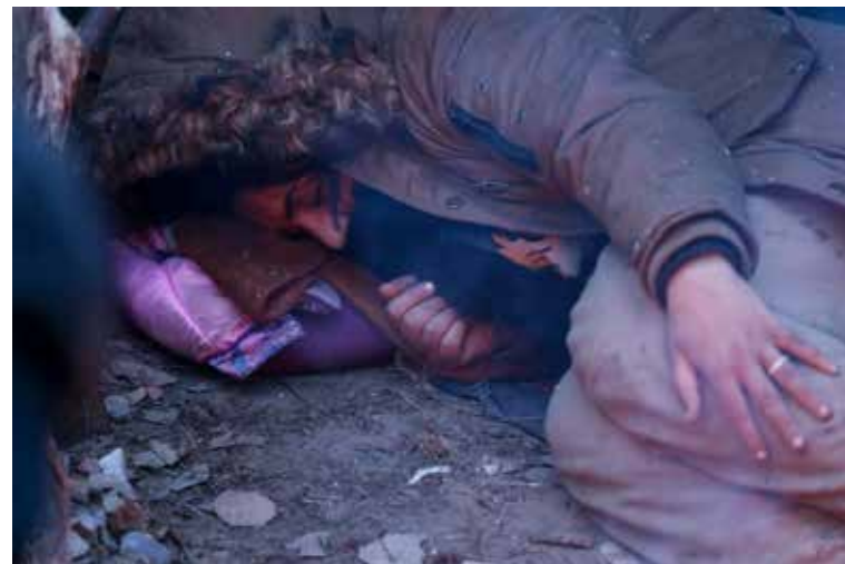
Утро в лагере беженцев