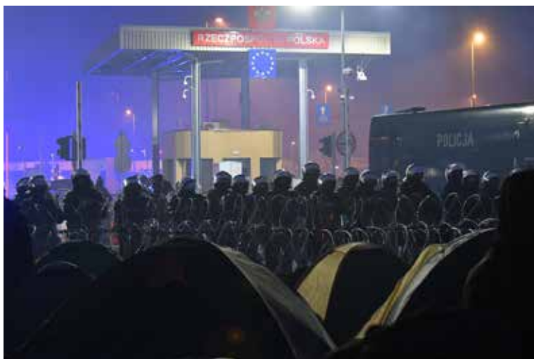
Вечер на погранпереходе

ли семь суток в надежде, что польская сторона выполнит свои обязательства в рамках миграционного законодательства и примет их прошения о предоставлении убежища. Очередную холодную ночь уже на бетоне проведут беженцы в пункте пропуска Брузги. Напротив беженцев у заграждения — вооруженные польские силовики. Пункт пропуска «Кузница Белостоцкая» сопредельная сторона усилила большим количеством военнослужащих, привлечена также специальная техника, включая водометы. В небе постоянно кружат польские военные вертолеты. Звучат угрозы из громкоговорителей, причем на разных языках. Чтобы согреться, беженцы развернули палатки уже на территории пункта пропуска непосредственно на асфальте и бетоне, разжигают костры в его окрестностях. Выходцы из стран Ближнего Востока продолжают находиться в ожидании гуманитарного коридора для дальнейшего следования в страны Евросоюза. Белорусской стороной ни оружие, ни спецсредства не применялись.