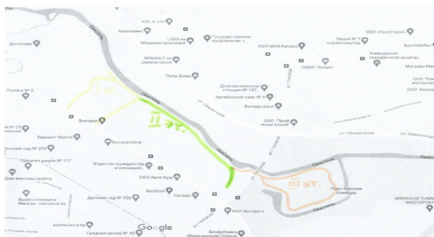
Схема расположения III этапа